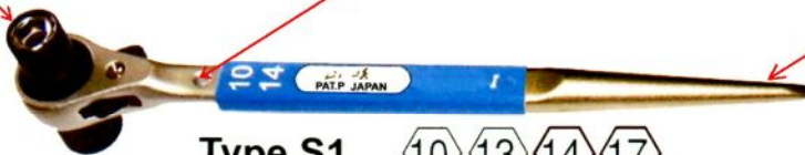
Type S1 10 13 14 17 mm