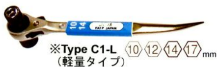
※Type C1-L 10 12 14 17 mm (軽量タイプ)